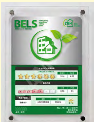
材質：透明アクリル