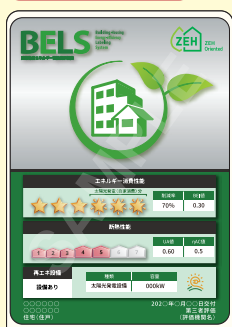
B5, B6, A6 サイズ