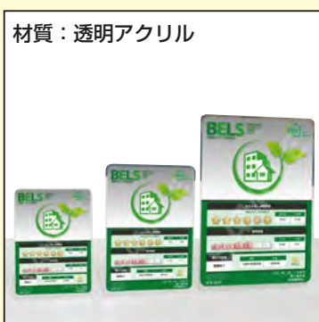
材質：透明アクリル

A6 本体：W105×H148 表示面：W105×H148 11,770 円 (税抜：10,700 円)