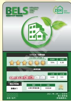
B5, B6, A6 サイズ